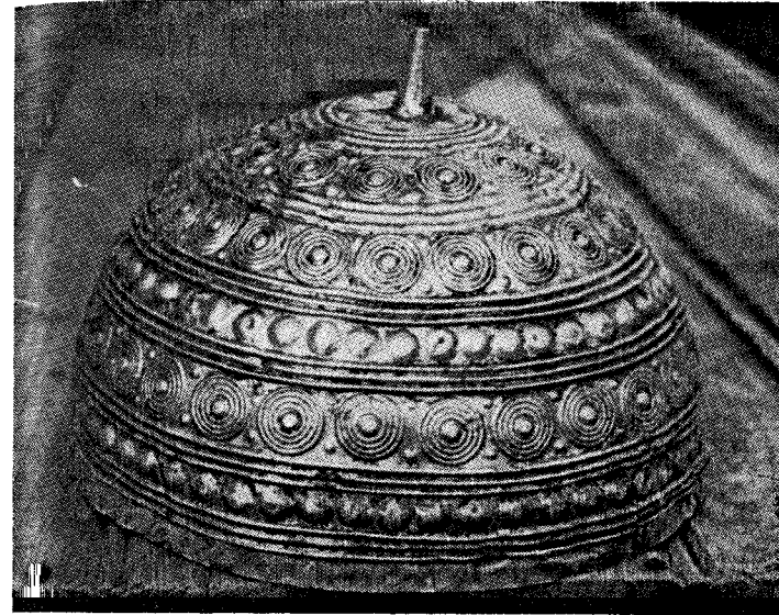
Fig. 1 — Capacete de ouro achado em Rianxo (La Coruña. Espanha.) Pertence ao Museu Arqueológico do Castelo de San Antón (La Coruña)