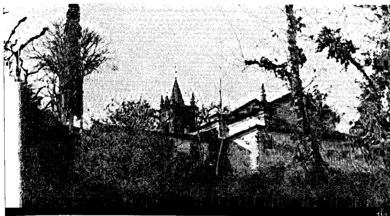
A Igreja da Casa da Cruz