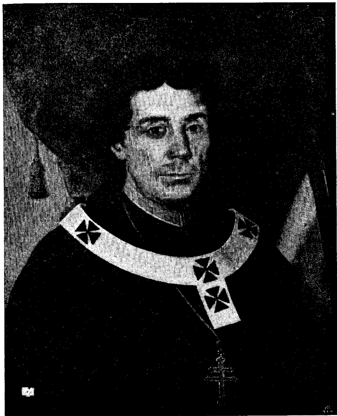
D. Frei Manuel do Cenáculo, um dos promotores das reformas pombalinas