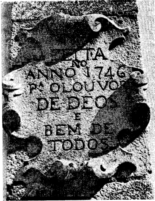
Leteiro num dos cunhais da Igreja da Casa da Cruz