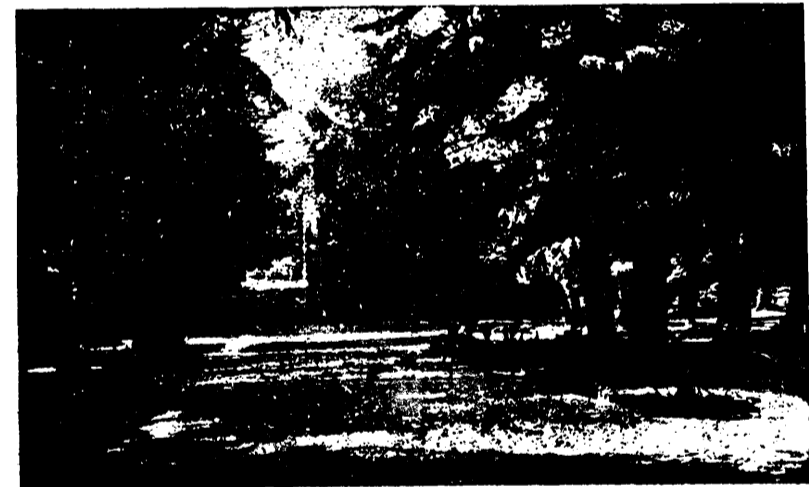
Um trecho do Parque de Vizela

— As festas da vila tiveram gestação demorada, mais de 30 anos, mas foi feliz o seu nascimento, e assim, este ano — o segundo — estou certo, elas, as festas da vila, já se lhes poderá chamar como a gente grande.