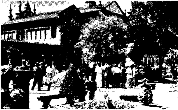
Os Congressistas nos jardins do Museu Arqueológico da Sociedade Martins Sarmiento

Pouco depois do meio dia efectuou-se a visita ao Museu Regional de «Alberto Sampaio»,