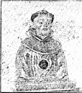
BUSTO-RELICÁRIO DE S. GUALTER CONSERVA-SE NA SACRISTIA DA IGREJA DE S. FRANCISCO (GUIMARÃES)

Levados à presença dos magistrados, foram examinados miudamente sôbre a sua fé, a sua procedência; os fins que ali os levavam.