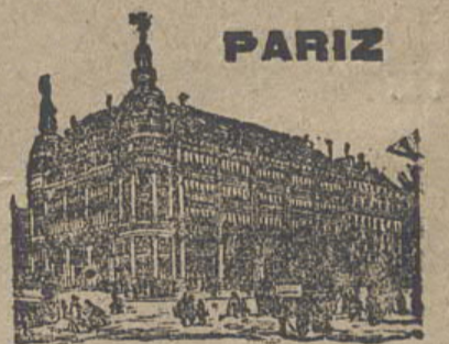
GRANDES ARMAZENS DO