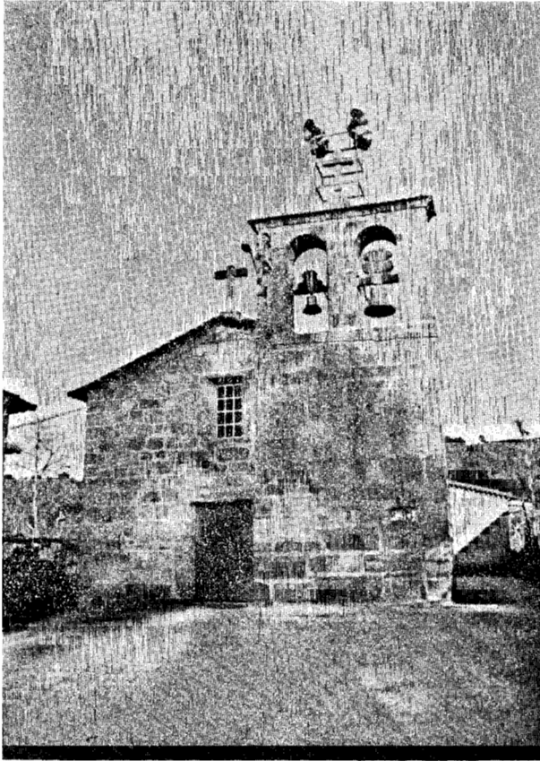
Igreja de Rendufe