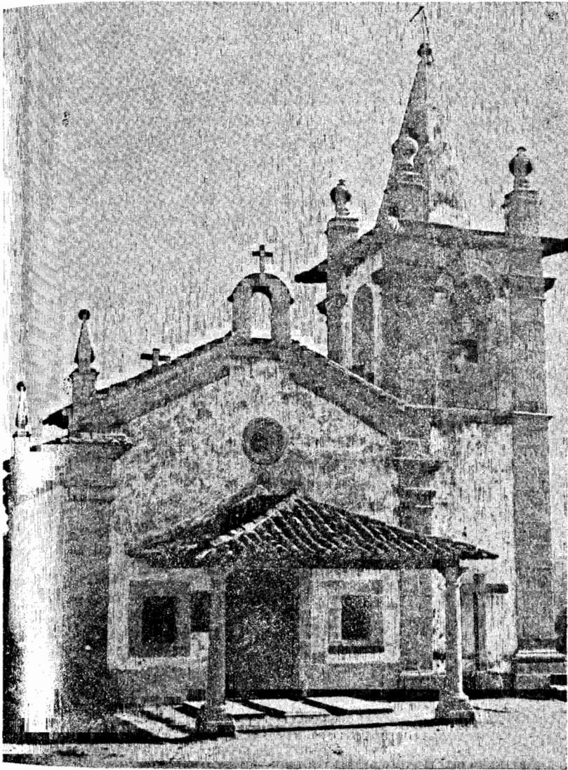
Capela do Bom Despacho — Gominhães