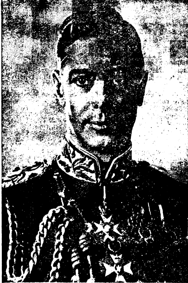
Sua Majestade o Rei Jorge VI

FOI recebida com magoada surpresa e profundamente sentida emoção a notícia do falecimento do Rei de Inglaterra e essa viva emoção dolorosa teve a gente portuguesa até nos mais pequeninos e dispersos recantos do nosso