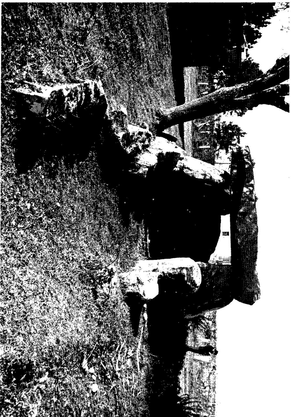
FIG. 2 — Dólmén da Barrosa (Ancora, Caminha) (altura actual do interior da câmara: c. 2 m; comp. do corredor: c. 4,60 m)