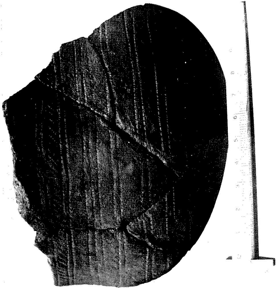
FIG. 5 — Vaso campaniforme, de tipo «internacional», da Mamoa de Guilhabreu (Vila do Conde). Escavações de Elisero Pinto (1952), Museu de Vila do Conde.