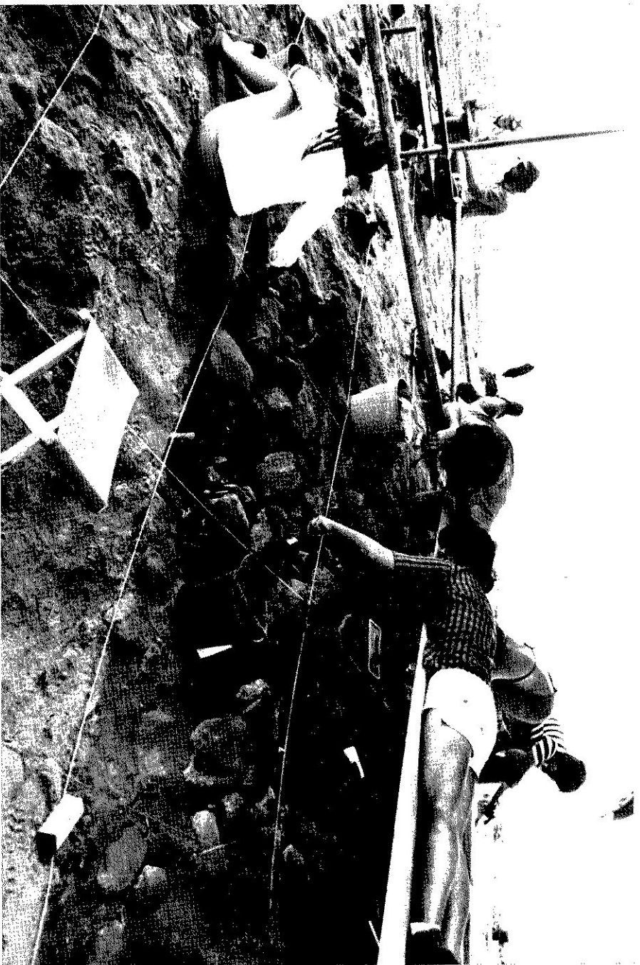
FIG. 6 — Elementos da Universidade do Porto, procedendo a decapagens durante uma campanha de trabalhos de carácter experimental na Mamoa n.º 1 do conjunto megalítico da Serra dos Campelos (Lusitosa, Conc. de Lousada), em Agosto de 1976.