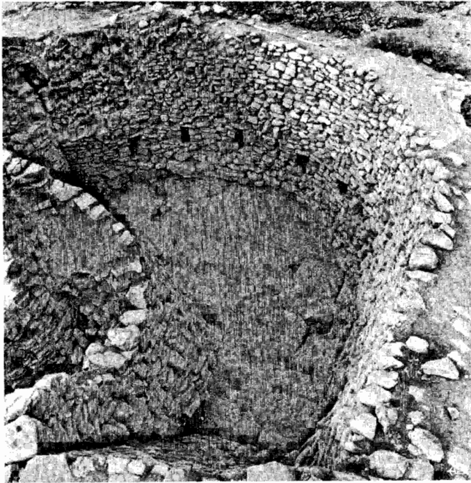
Fig. 3 — A barbacã vista do lado Sul