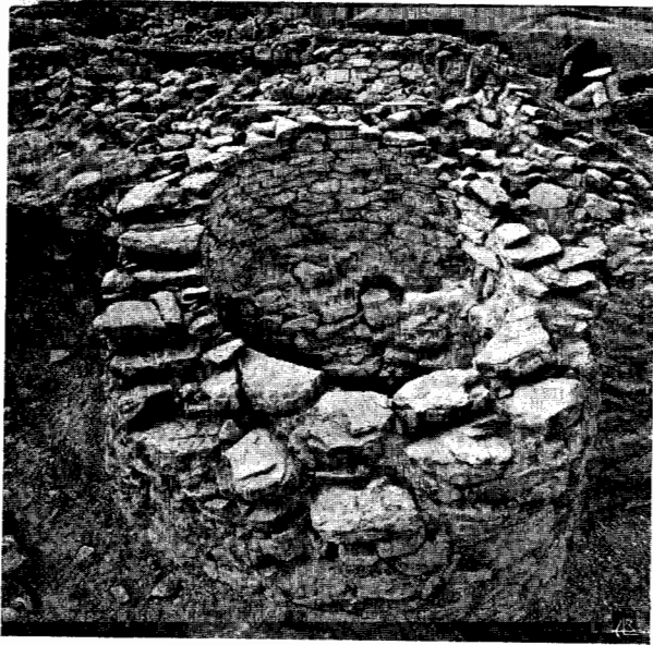
Fig. 2 — Torre A