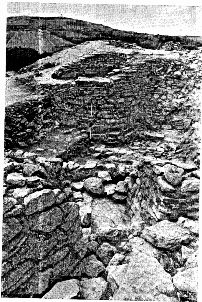
Fig. 7 — Zona central com torre B, entre a fortificação interior e a exterior (Campanha de 1970).