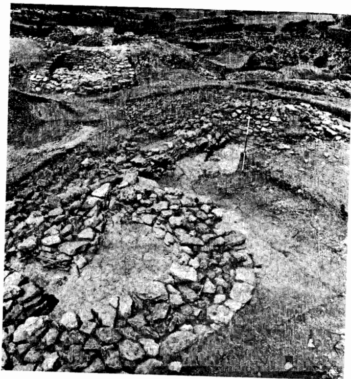
Fig. 5 — Vista de Sudeste da fortificação exterior (torre semicircular K) e da interior (torres circulares B e A).