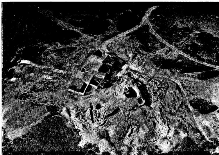
Fig. 6 — Vista aérea tirada do Sul. (Campanha de 1970).