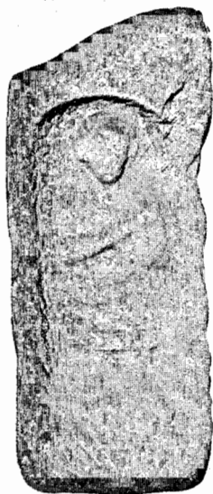
Fig. 1—Escultura procedente del Monte de la Saia (Barcelos, Portugal).

Entre los datos, que allí se dan, figuran el tamaño del bloque, 1, m 10 de alto por 40 cm. de ancho, y el lugar de su origen, que según las anotaciones de Martins Sarmento fué al lado de otro similar que representa un joven cogiendo la cabeza de un toro, adosadas ambas en el muro de una edificación que se considera funeraria situada en el monte de la Saia, de Barcelos.