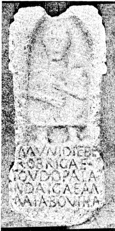
Fig. 3 — Escultura procedente de Talaván (Cáceres).

Como se vé no hay unanimidad de pareceres sobre la persona representada, que cada cual estima a su modo y, desde luego, sin suponer que pueda tratarse de la misma y sin coincidir ni siquiera en el sexo: Sin embargo, consultando las láminas de la obra de Vives Escudero « Estudios de Arqueología Cartaginesa » (Madrid, 1917), que reproducen las figuras de tierra cocida de la época cartaginesa halladas en Ibiza, se notan tales analogías entre estas esculturas y aquellas figuritas, que convencen pronto de que se trata de una mujer y de la misma época o del mismo estilo, por lo menos, que las allí representadas; las orejas grandes, extendidas y abocadas hacia adelante, el cuerpo desproporcionado, deforme y feo, la labor tosca, el calzado apreciable en la de Cartagena, con un adorno amplio sobre el pie al estilo del de la gran dama que allí se ve en la lámina LXXXV, y el manto ( peplo o palla ) recogido en pliegues simétricos en la misma forma