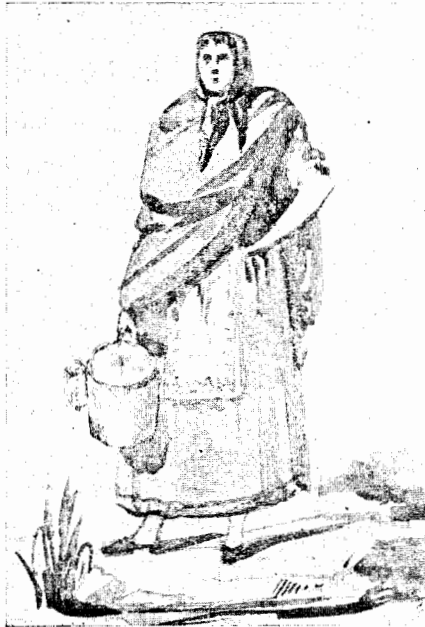
Fig. III — Leiteira de Guimarães. Desenho de Francisco José Resende. 1858.

Os cadernos dêsse género, como documentos biográficos, não são dos que oferecem menor interêsse