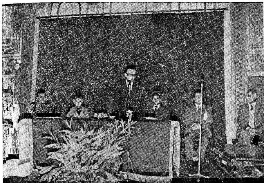
O Governador Civil no uso da palavra