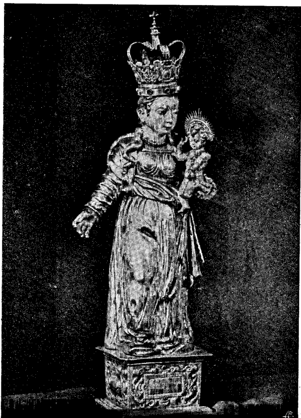
Imagem de prata de Nossa Senhora do Rosário