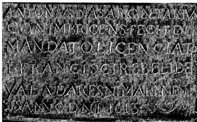
Inscrição na parte posterior do plinto