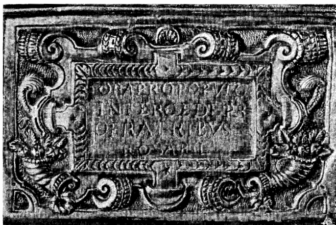
Inscrição na parte anterior do plinto