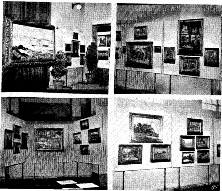
Quatro aspectos da Exposição póstuma do Pintor vimeirense Abel-Cardozo.