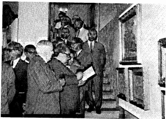
O Senhor Governador Civil de Braga visitando a Exposição.