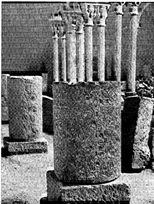
Inscrição consagrada aos imperadores Marco Aurélio e Lúcio Cómodo.