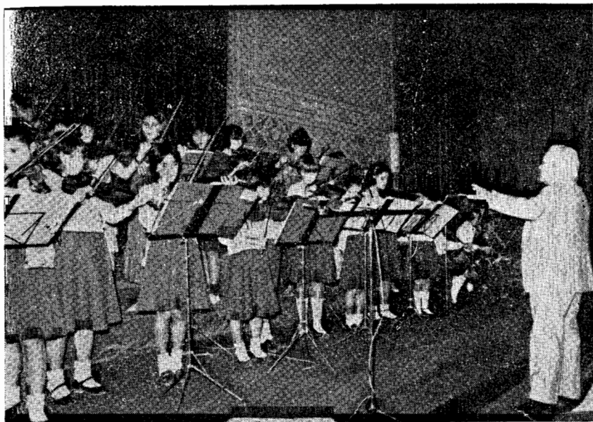
Exibição da Escola de Música de Bairro — Famíliação, sob a direcção do maestro Resende Dias