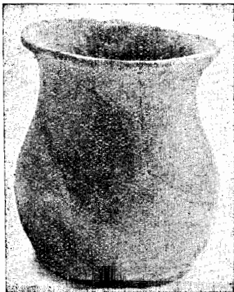
Pequeno vaso campanular restaurado pelo Sr. Ant3nio de Azevedo.