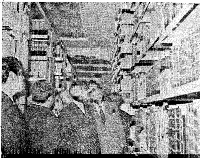
O Senhor Prof. Doutor Marcelo Caetano, Chefe do Governo, visita a Soc. Martins Sarmento: Percorrendo a Biblioteca.