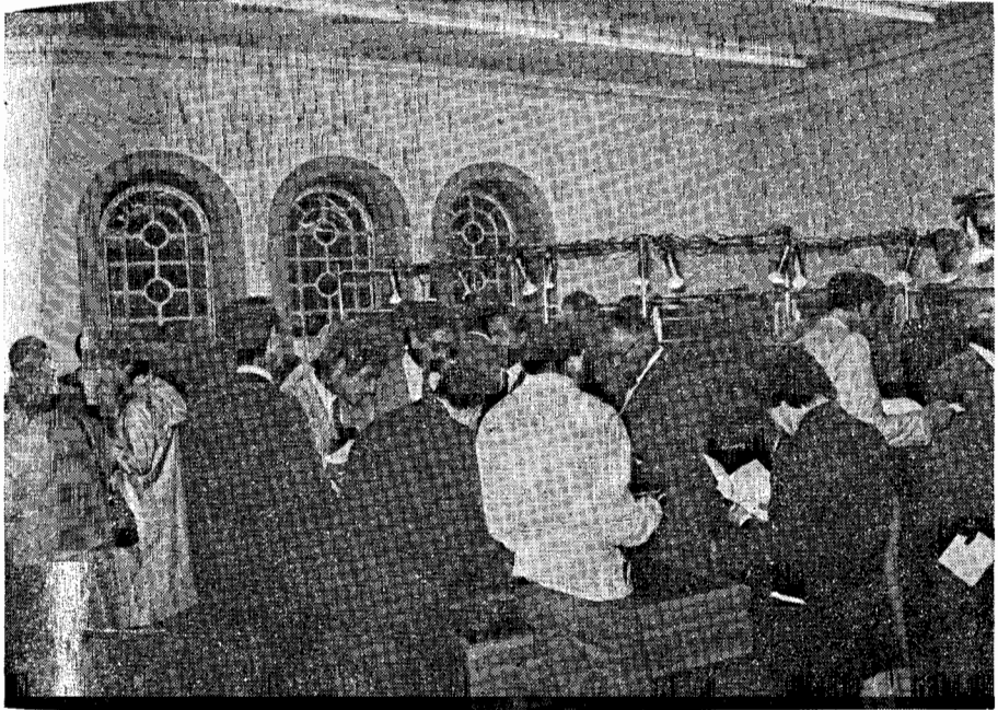
Aspecto da Exposição de Medalhística do Banco Borges & Irmão