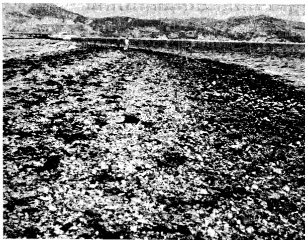
Fig. 1 — Zona de lastros a 350-400 m a montante da ponte-cais que se vê ao fundo, à esquerda. No último plano, o extremo oriental da Arrábida.