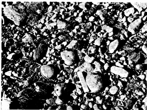
Fig. 2 — O a indica uma peça languedocense antes de ser recolhida.