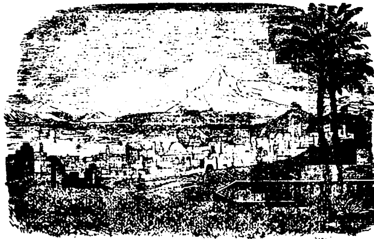
CIDADE DE TUNIS

A já muito tempo que o «Progresso Catholico» nada nos diz acerca d'esta formosa perola do Oceano , provavelmente não será por falta d'assumpto, pois existe em gran-