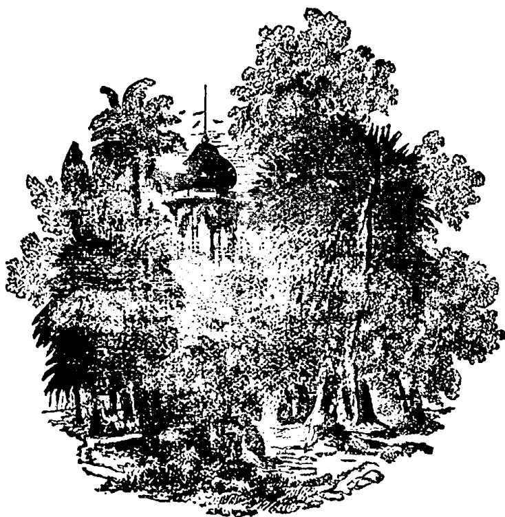
PAGODE EM BENARÉS

Infelizmente nem todos protestaram, houve talvez uns 20 que pelo seu si- lencio fizeram crer que acceitaram a defeza do Latego . Infelizes! Não se lem- brarem que os membros sem cabeça hão de morrer de inanição. No entanto a grande maioria do clero protestou d'um modo tão energico no jornal A Verdade que compensou bem a falta dos que omittiram esse dever e deram de si uma triste idèa do que são e do que valem.