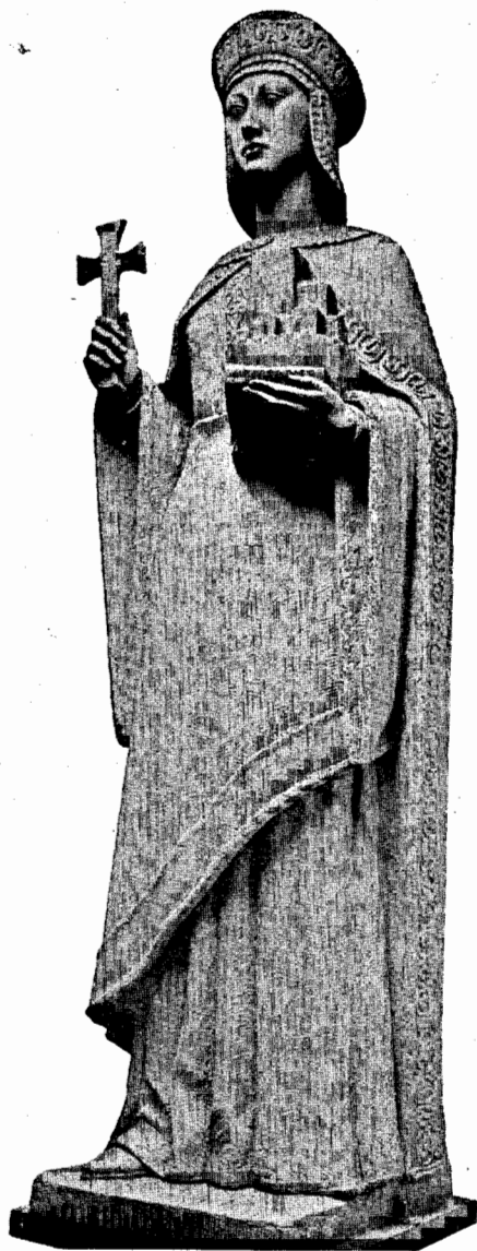
A estátua da Condessa Mumadona, a erigir em Guimarães.