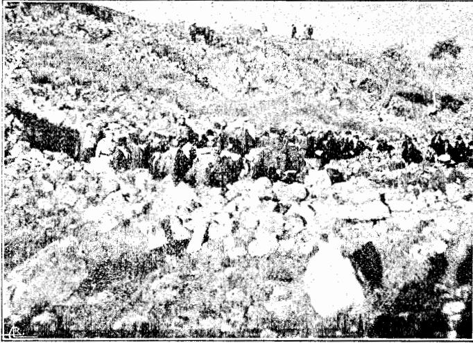
Visita às ruínas da Citânia de Briteiros

nome de Martins Sarmento está indissolúvelmente ligado a Briteiros. Falar em Briteiros é falar em Martins Sarmento.