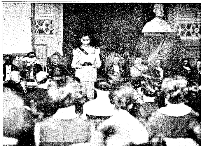
O Presidente da Soc. M. S. lendo o discurso de abertura da Sessão Solene realizada na noite de 11 de Junho de 1933.