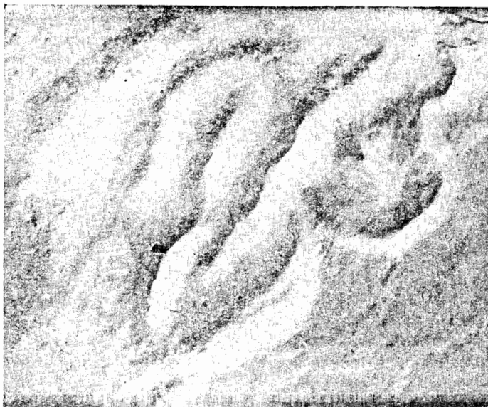
Fig. 9 — Insculptura no reverso da Pedra, segundo a fotografia dum decalque. (Dimensões : 0,20 x 0,15)

hipóteses, convencido talvez de uma intervenção acidental, muito posterior à execução da pedra, o que é mais natural. Já Virchow (1) e Cartailhac (2) se referem à «figure bizarre». J. Possidónio chamou-lhe «letra mural» (3) e Teixeira de Aragão — «espécie de monograma» (4) . Sempre a fantasia dos epigrafistas! O Sr. Leite de Vasconcelos e Emílio Hübner chamaram-lhe «sinal inexplicado» (5) e «signum» (6) . Mas o ilustre Arqueólogo espanhol Sr. Cabré, foi decisivo quando afirmou nas «Actas y Memorias da Soc. Esp. de Antr.,