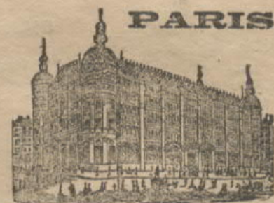
GRANDES ARMAZENS DO

A' venda na livraria—Cruz Coutinho—Editora. Rua dos Caldeiros, 18 e 20,