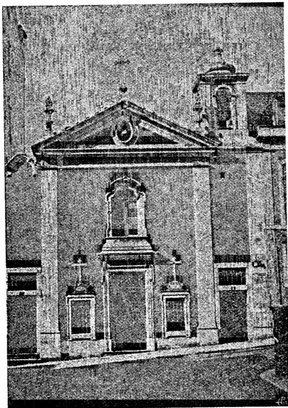
Fig. 4 — Capela do Senhor Jesus dos Navegantes e de Nossa Senhora da Caridade, construída no século XVIII, após o terremoto de 1755, para as imagens salvas da sua capela na igreja do Real Mosteiro de N.ª S.ª da Esperança.