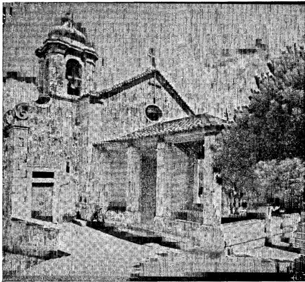
Fig. 2 — Ermida medieval de Nossa Senhora do Monte (Monte de S. Gens) reconstruída ou restaurada no século XVIII.